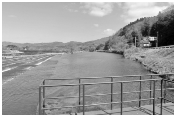
写真-2. 堰の取水点における流軸景の例 (小川江筋堰、福島県、夏井川)