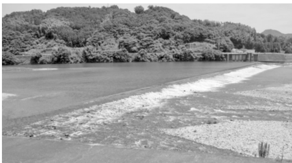
写真-1. 八田堰 (高知県、仁淀川)

このように、川と地域との関わりを表象する堰が、国内には沢山ある。しかし近年、利水や治水機能の改善要請から、撤去や可動化が進んでいる。利水、治水、生態系の視点に加えて、親水性や人の関わり、文化的景観も含む様々な視点から、堰のあり方について議論する必要があると考える。